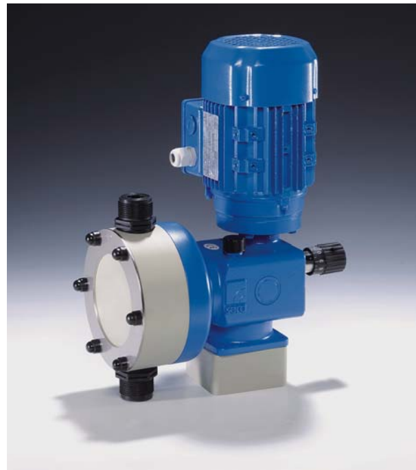
SERA enkelmembranpump R 409.2-250 e